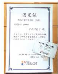
認定証と認定カードを発行