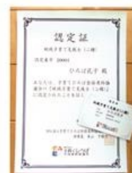
認定証と認定カードを発行