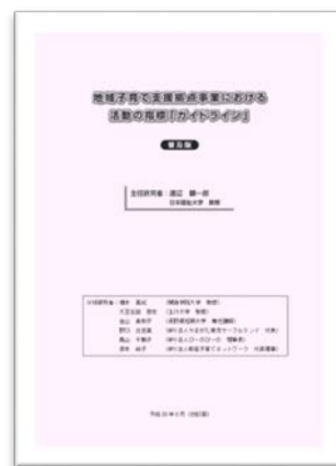
地域子育て支援拠点事業における活動の指標「ガイドライン」