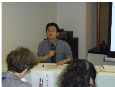
コーディネーター