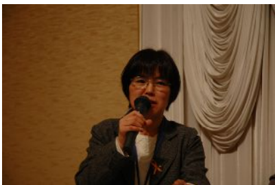
コーディネーター