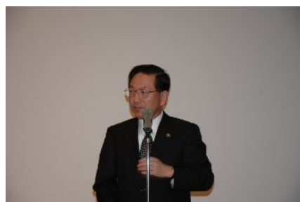
開催地歓迎挨拶 白河市長 鈴木 和夫様