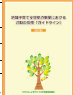
地域子育て支援拠点事業における活動の指標「ガイドライン」

■主催・お問合せ先:NPO法人子育てひろば全国連絡協議会 (ひろば全協) 〒222-0037 横浜市港北区大倉山1-12-18-303 TEL:045-531-2888/045-546-9970(受付時間:平日9:00~17:00) FAX:045-512-4971 E-mail:kenshu@kosodatehiroba.com